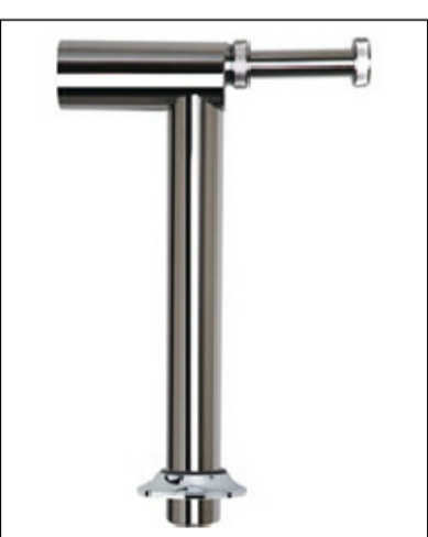
6. SANITÁRIO COM LAVATÓRIO E CAIXA D'ÁGUA