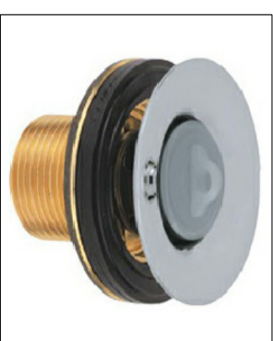
5. SANITÁRIO COM LAVATÓRIO E CAIXA D'ÁGUA