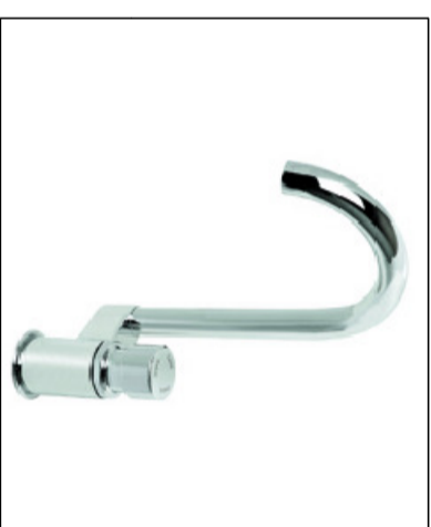
2. SANITÁRIO COM LAVATÓRIO E CAIXA D'ÁGUA