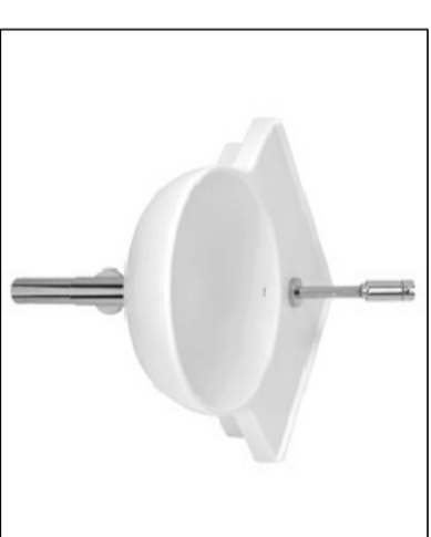
3. SANITÁRIO COM LAVATÓRIO E CAIXA D'ÁGUA