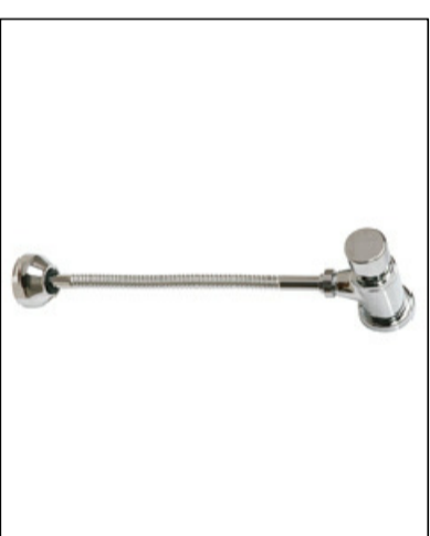
4. SANITÁRIO COM LAVATÓRIO E CAIXA D'ÁGUA