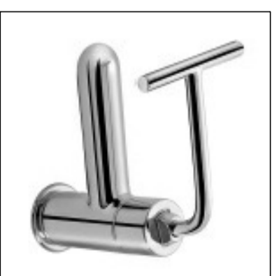
7. SANITÁRIO COM LAVATÓRIO E CAIXA D'ÁGUA