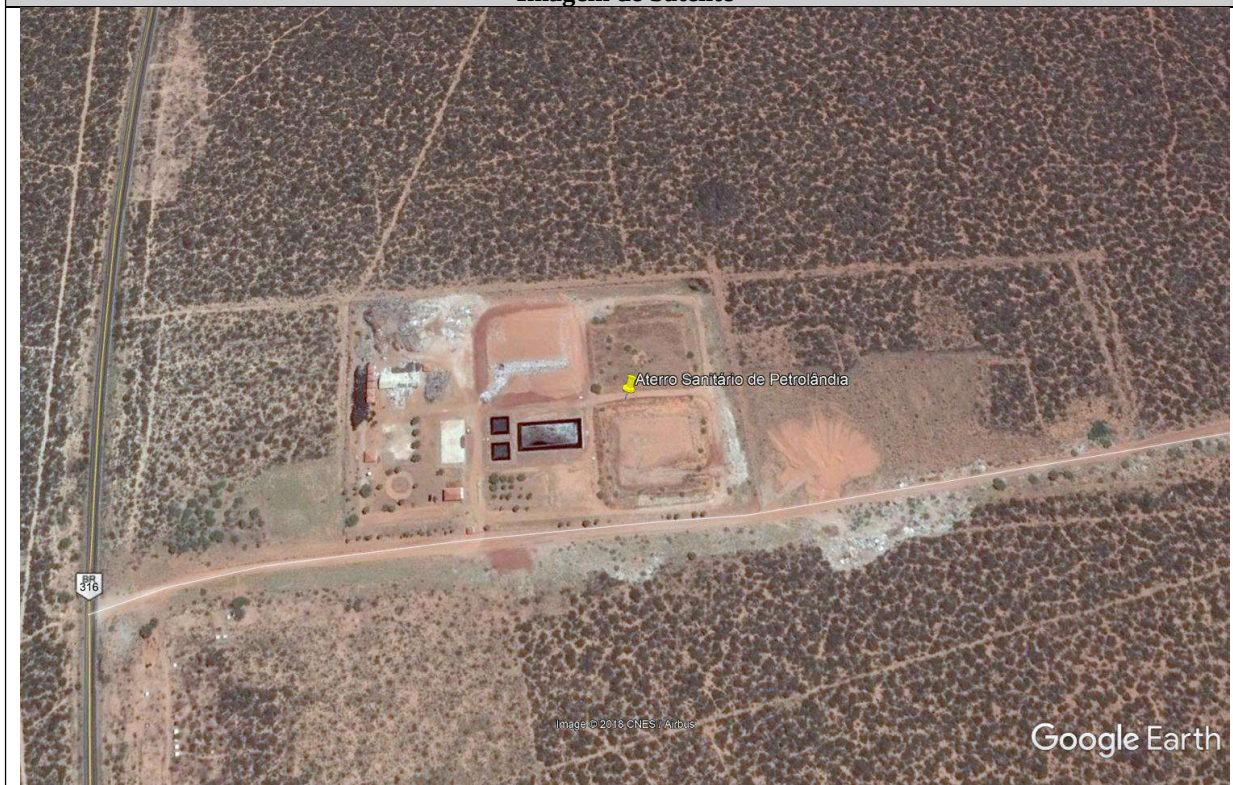
Vista do Aterro Sanitário de Petrolândia – Imagem de 09/04/2016