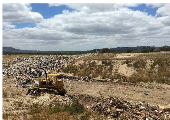
Foto 2: Frente de serviço com grande volume de resíduo domiciliar sem cobertura