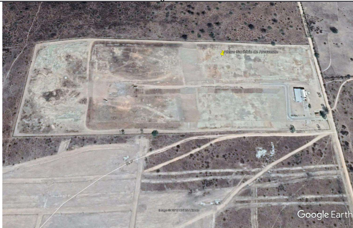
Localização do Aterro Sanitário de Arcoverde – Imagem de 21/11/2017