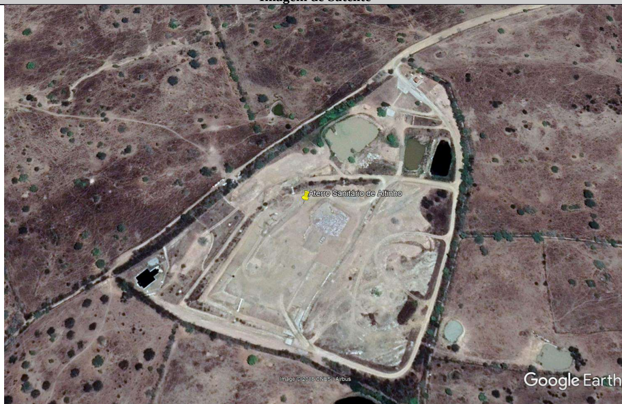
Vista Aterro Sanitário de Altinho – Imagem de 06/12/2017