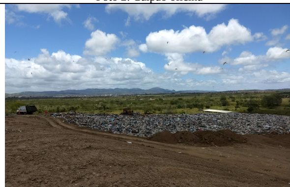
Foto 4: Grande volume de resíduos sem recobrimento e com aves no entorno