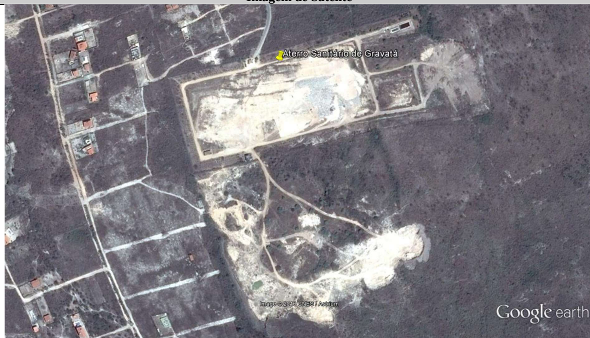
Vista do Aterro Sanitário de Gravatá – Imagem de 05/11/2015