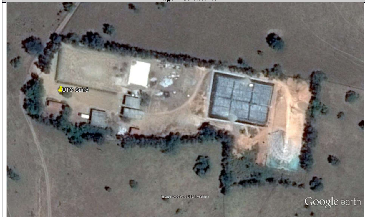
Vista da UTC-Sairé – Imagem de 05/11/2015