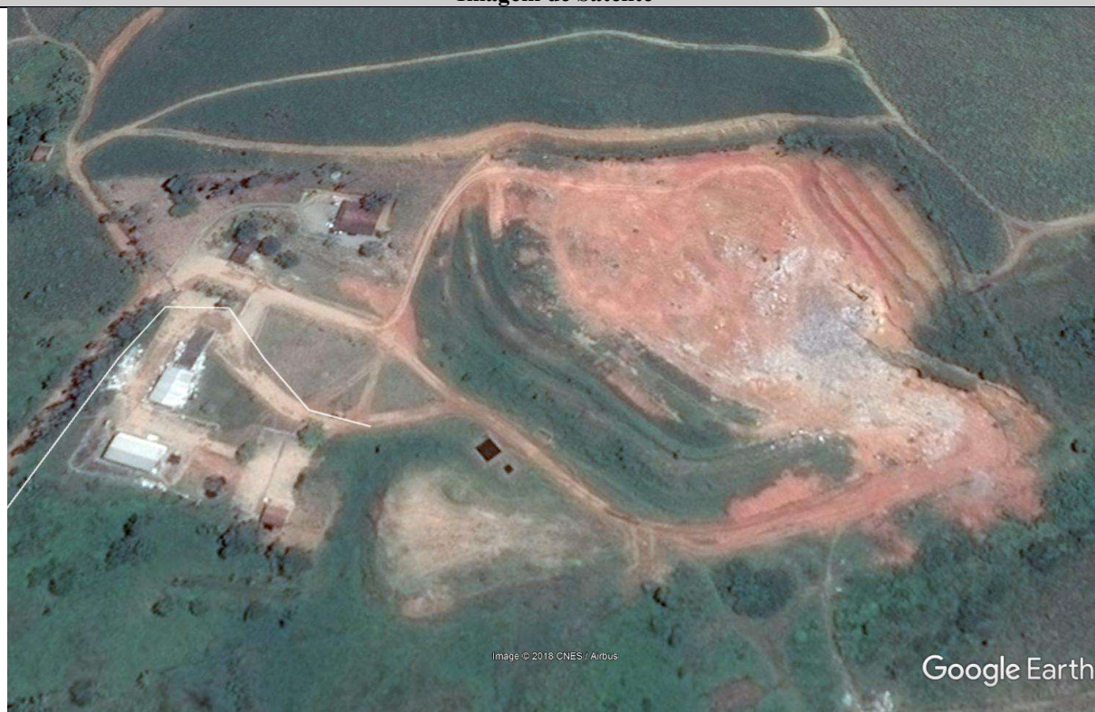
Vista Aterro Sanitário de Rio Formoso– Imagem de 07/09/2016